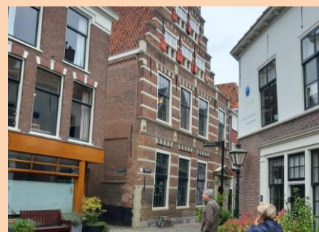
De Latijnse School.